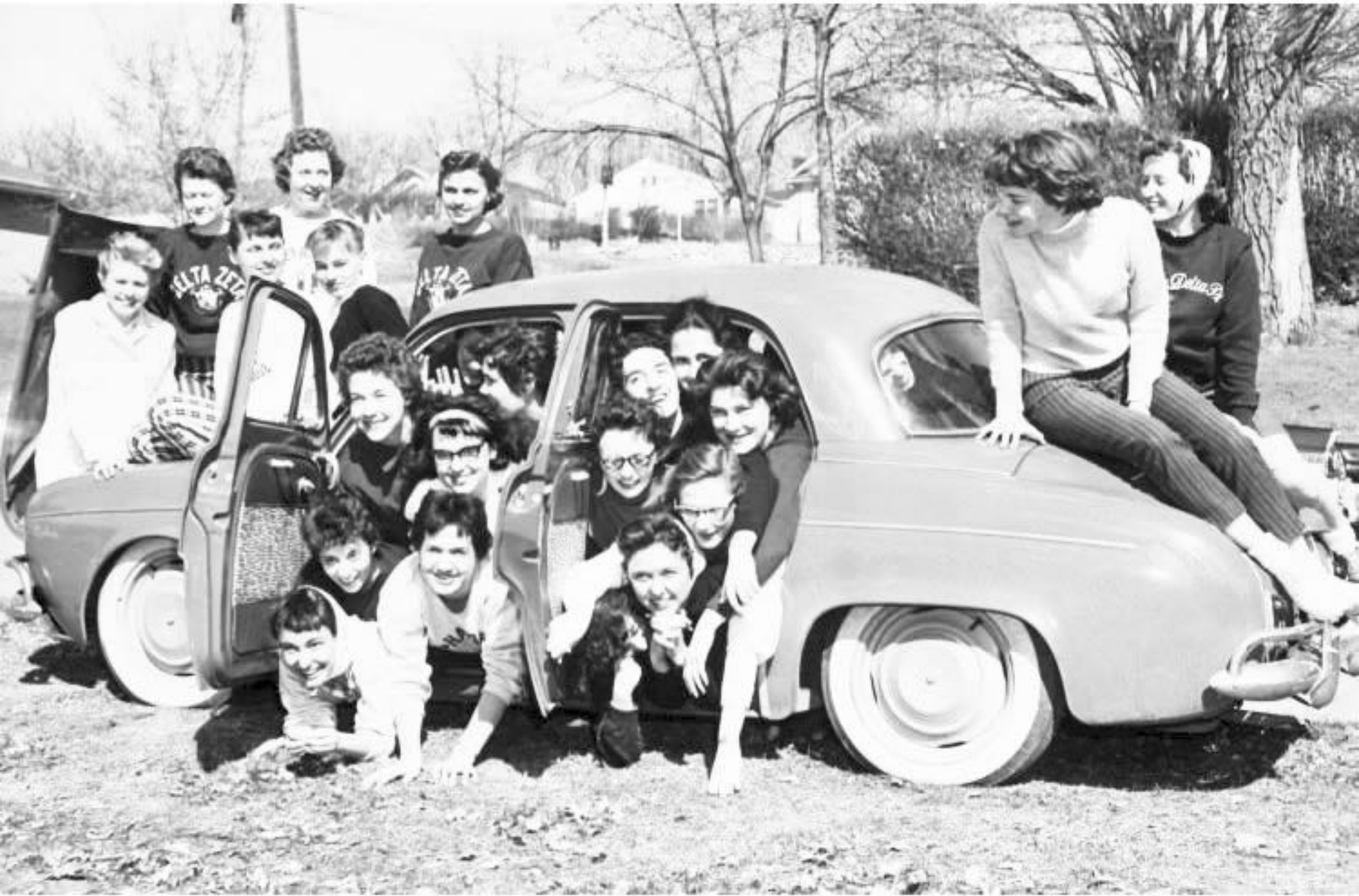
Sorelle della fraternita Alpha Delta Pi e Delta Zeta dentro una Renault per battere il record di 27 donne in un'auto, 1959, Sioux City, Iowa.