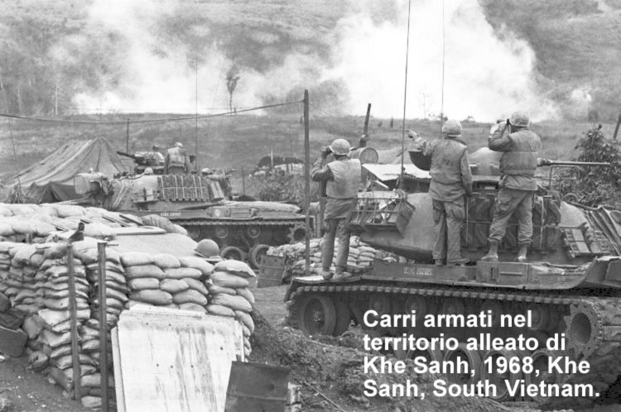
Carri armati nel territorio alleato di Khe Sanh, 1968, Khe Sanh, South Vietnam.