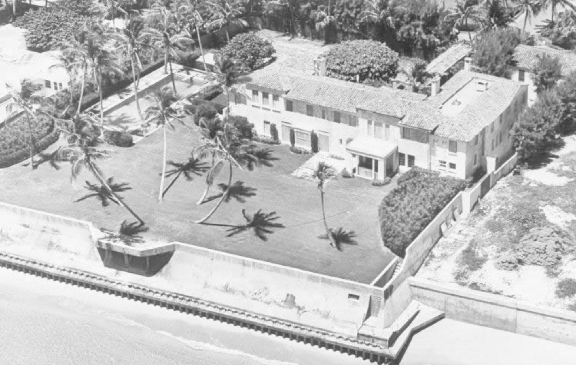
Vista aerea della villa di Joseph P. Kennedy (padre di JFK), 1961, Palm Beach, Florida, USA.