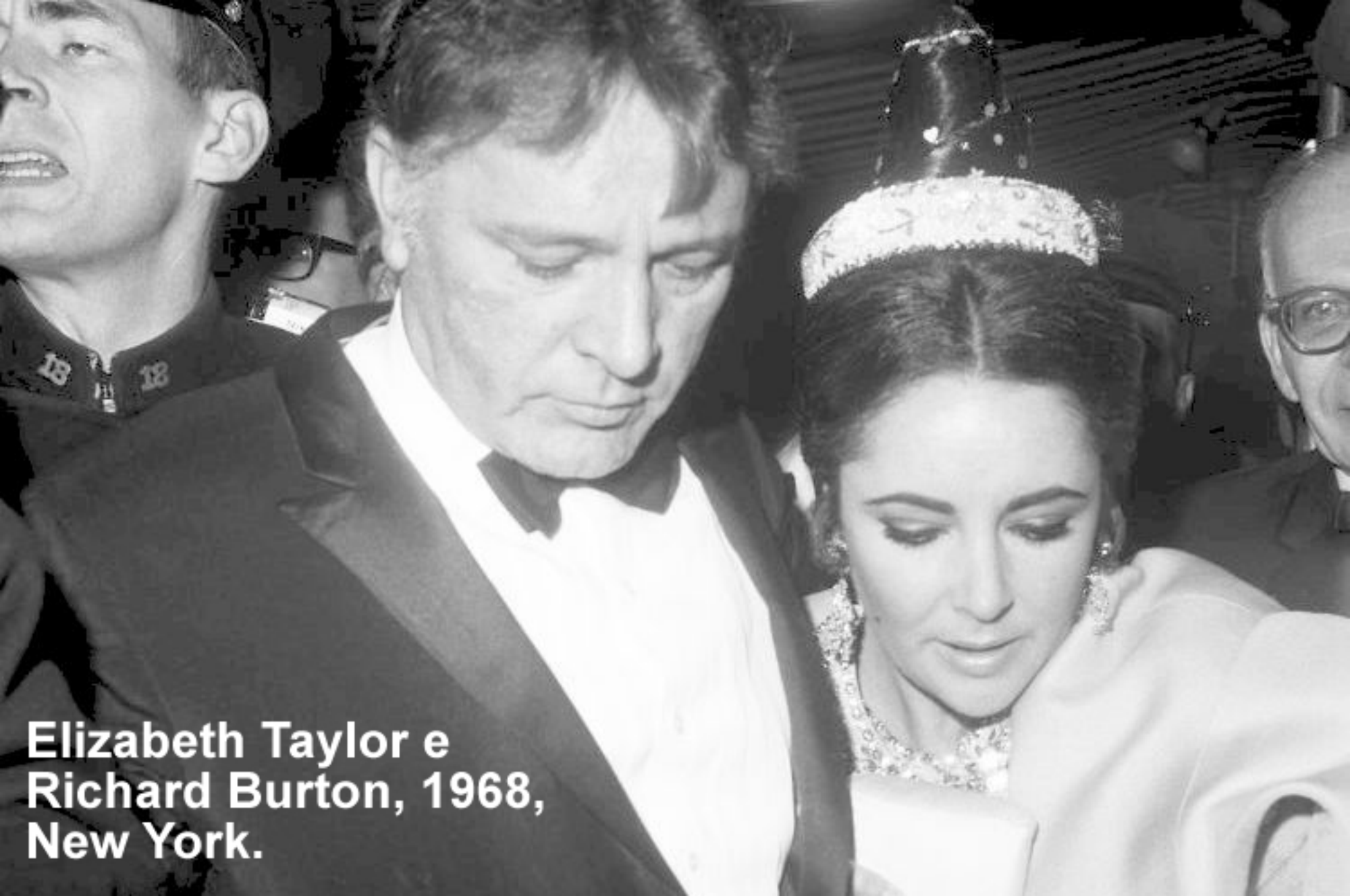
Elizabeth Taylor e Richard Burton, 1968, New York.